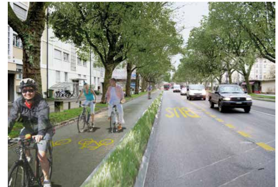
Winkelriedstrasse (B): Radweg 2.50m mit durchgehend neuem Belag