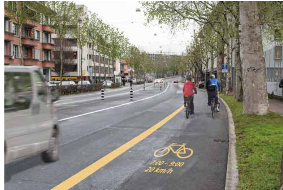
Nordring (E): Radstreifen 2.50m, in den Haltestellenbereichen gibt es eine Umweltpur