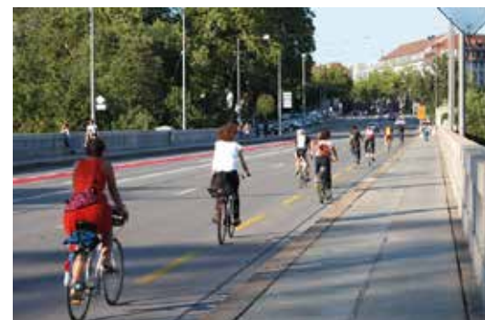
Breitere Radstreifen auf der Lorrainebrücke folgen in einem zweiten Schritt.