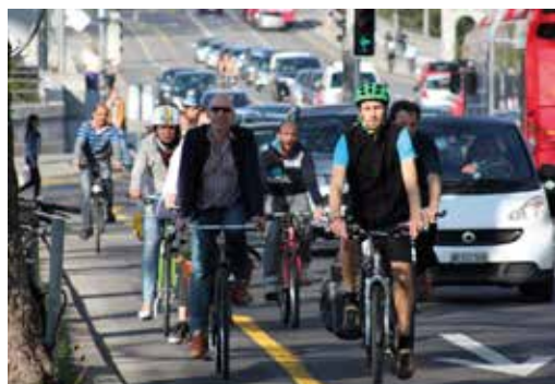
Verbreiterung Radstreifen entlang Schützenmatte - Schliessen der letzten Netzlücke Richtung Bahnhof