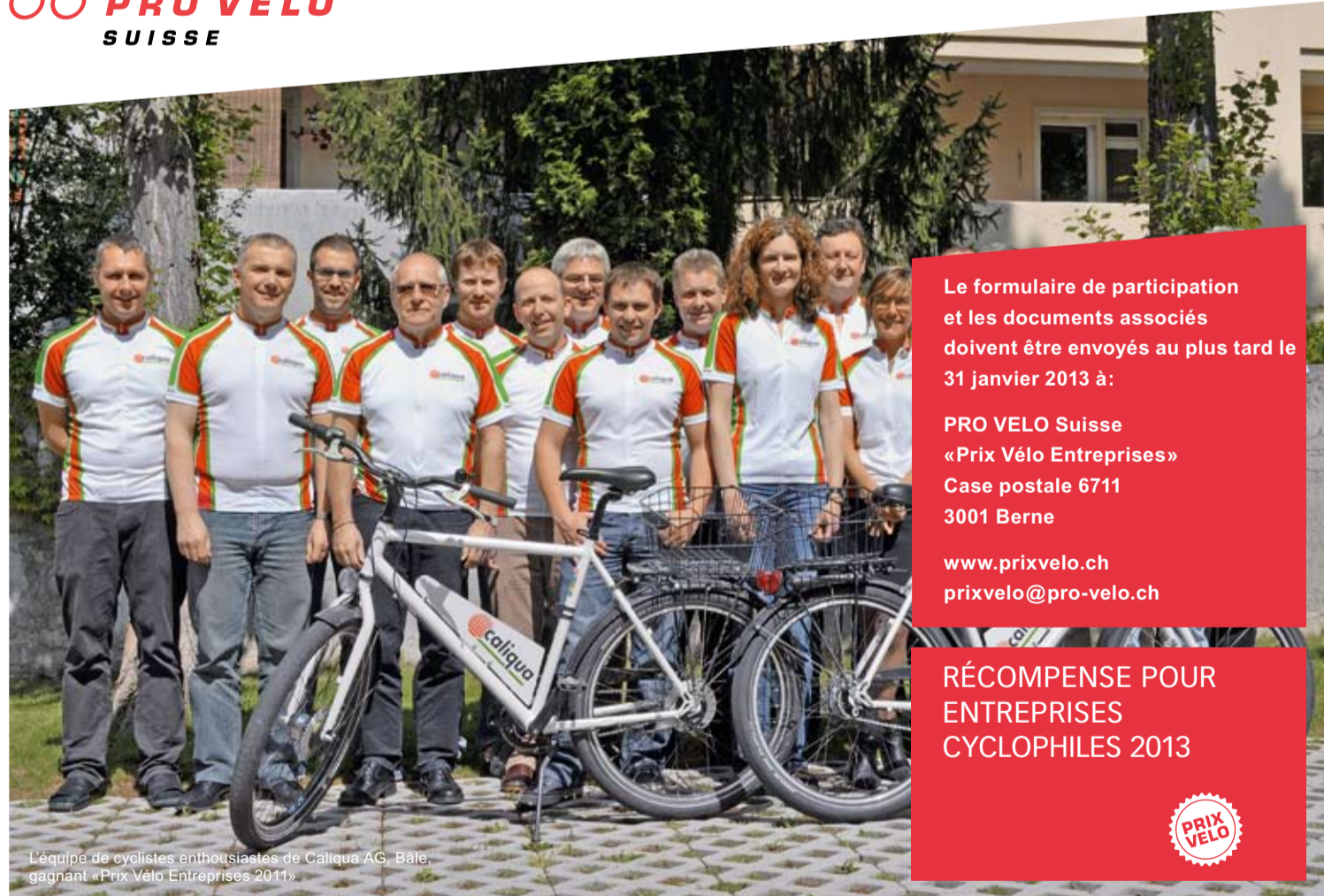
L'équipe de cyclistes enthousiastes de Caliqua AG, Bâle, gagnant «Prix Vélo Entreprises 2011»

Toutes les entreprises primées seront mentionnées sur le site Internet www.prixvelo.ch et dans le cadre d'un évènement médiatique.