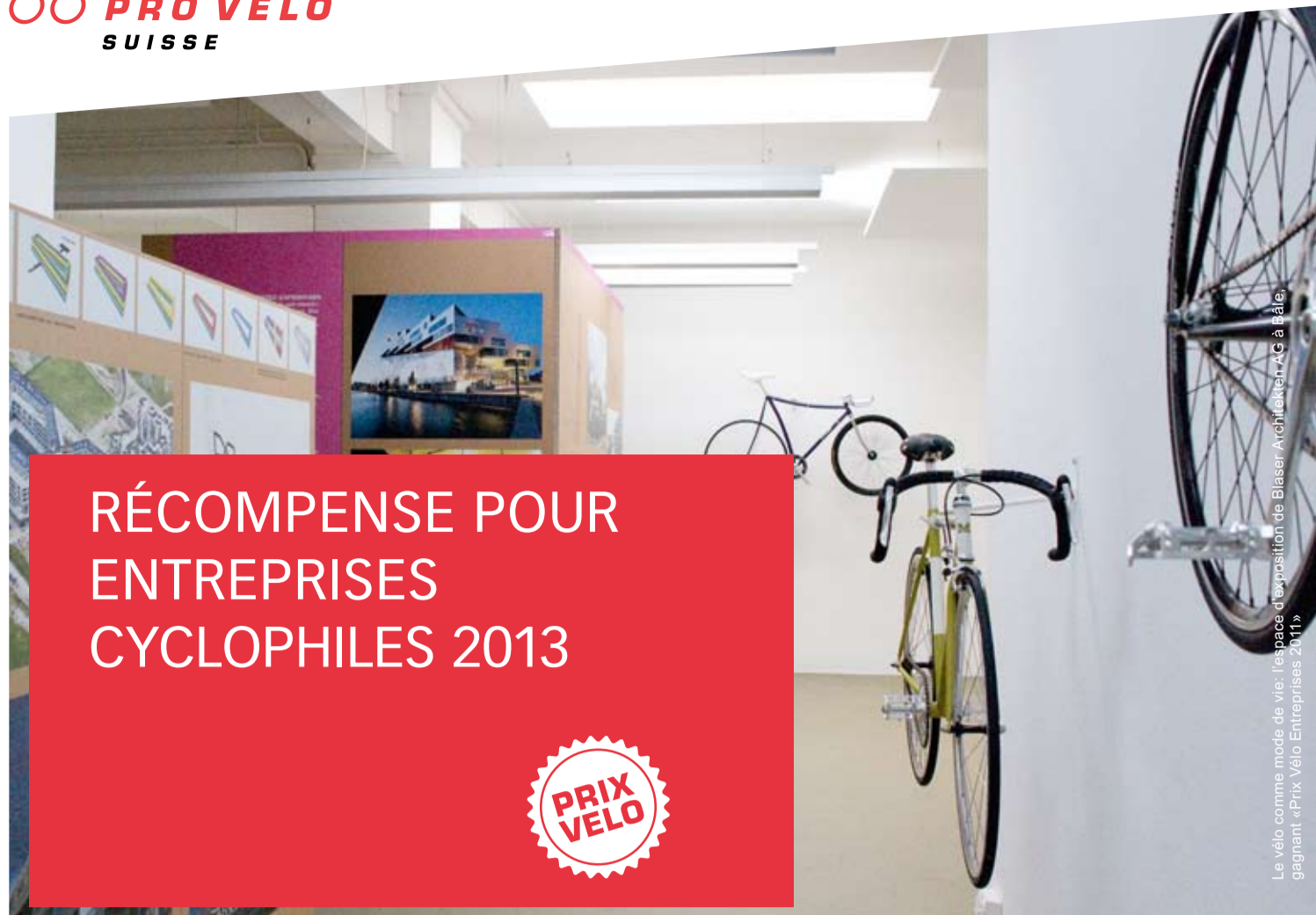
Le vélo comme mode de vie: l'espace d'exposition de Blaser Architecture AG à Bâle, gagnant «Prix Vélo Entreprises 2011»