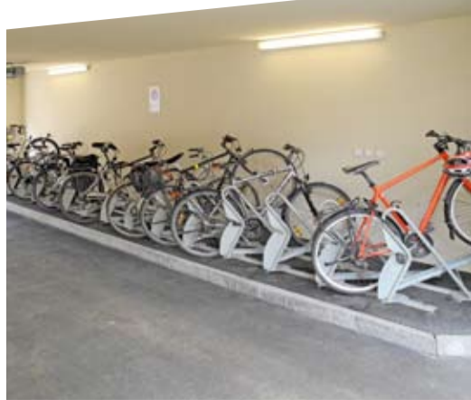
Stationnements pour vélos de Caliqua AG, Bâle, gagnant «Prix Vélo Entreprises 2011»

Les partenaires du «Prix Vélo Entreprises» sont l'Office fédéral de l'environnement (OFEV), Biketec, velosuisse et velopa.